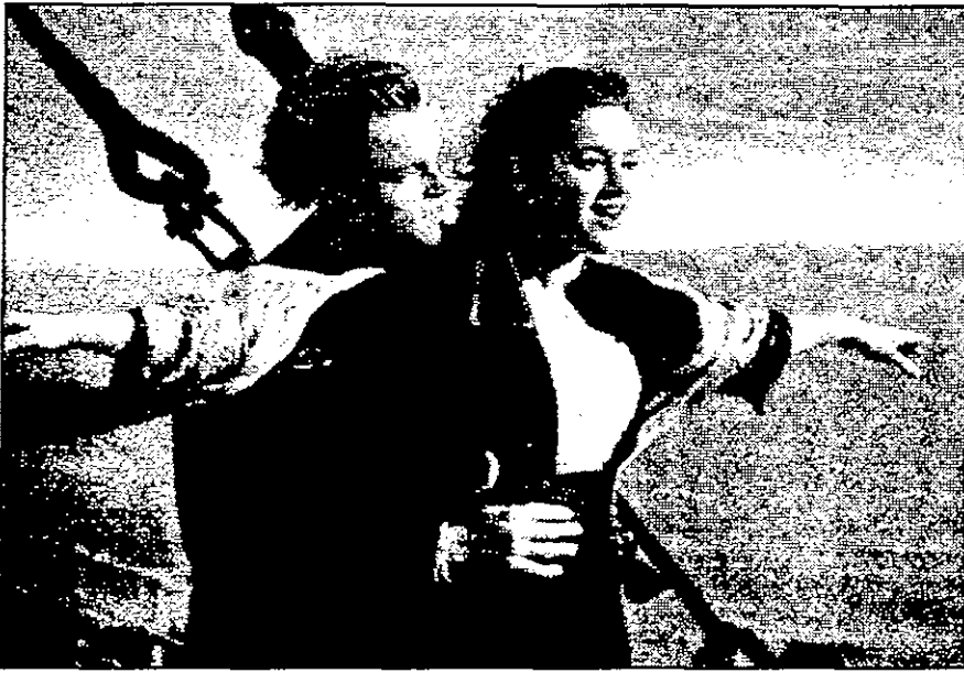
صوت التي ذهبت لكل من جاري ريسستورم وتوم جونسون وجاري سامرز ومارك اولانو وجائزة أوسكار احسن مؤثرات صوتية التي حصل عليها كل من توم بلقورت وكروستوفر بويز. وكانت حصيلة حصاده 11 جائزة اهمها جائزة أوسكار احسن فيلم وجائزة أوسكار احسن اخراج التي فاز بها المخرج جيمس كاميرون الذي تتنازل عن اجره في الفيلم في محاولة لتقليص تكاليفه بعد ان تخبطت الميزانية الاصلية للفيلم.

تعددت التوقعات التي تحيات بموز فيلم «تاييتانيك» باغب جوائز أوسكار هذا العام، فقد فاز فيلم للخرج الأمريكى جيمس كاميرون بأحدى عشر جائزة من جوائز أكاديمية الفنون والعلوم السينمائية (الأوسكار) لهذا العام وذلك مساء أول أمس الاثنين في لوس انجلس (كاليفورنيا) معادلاً بذلك الرقم القياسي الذي سجله فيلم «بين هور» عام 1960. لكن رغم كل هذا العدد الهائل من الجوائز اقلقت جائزتان من اهم جوائز الأوسكار في المسابقة السنوية السبعين للاكاديمية من تاييتانيك وهما جائزة احسن ممثل واحسن ممثلة وفاز بهما جاك نيكولسون وهيلين هنت من دورهما في فيلم (احسن ما يمكن) عن قصة حب معقدة بين نائلة في مطعم وكاتبة غريب الأطوار. كاميرون قال معلقاً على فوزه «هناك ملك العالم، انني أفضي بالفعل وقتاً ممتعاً». وقال نيكولسون مارحاً لحظة علمه بتحقيق حلم الحصول على الأوسكار ان «شعور الفرح لا يزني طوال الليل» في اشارة واضحة إلى فيلم السبقية المتكوية تاييتانيك الذي رشح لنيل 14 جائزة أوسكار، وتنافس نيكولسون على هذه الجائزة مع مات دامون («عذوبيل هنتنغ»)، وروبرت نوبال («الرسول»)، وبيتر فوندا («ذهب أولي») وداستان هوفمان («ماضيت الكلب» - واذ ذي نوح). وتبع هيلين وهي الممثلة الأمريكية الوحيدة التي رشحت لنيل جائزة أوسكار احسن ممثلة لهذا العام في فيلم (احسن ما يمكن) دور ام وحيدة